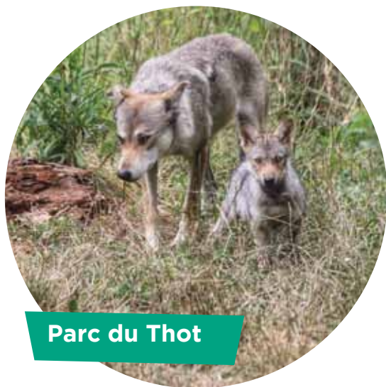
Parc du Thot