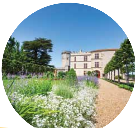
Château de Bourdeilles