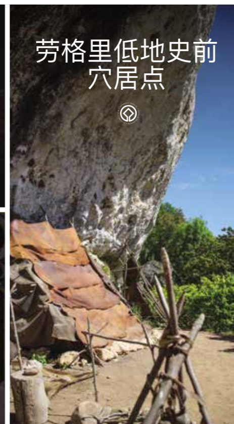
劳格里低地史前穴居点